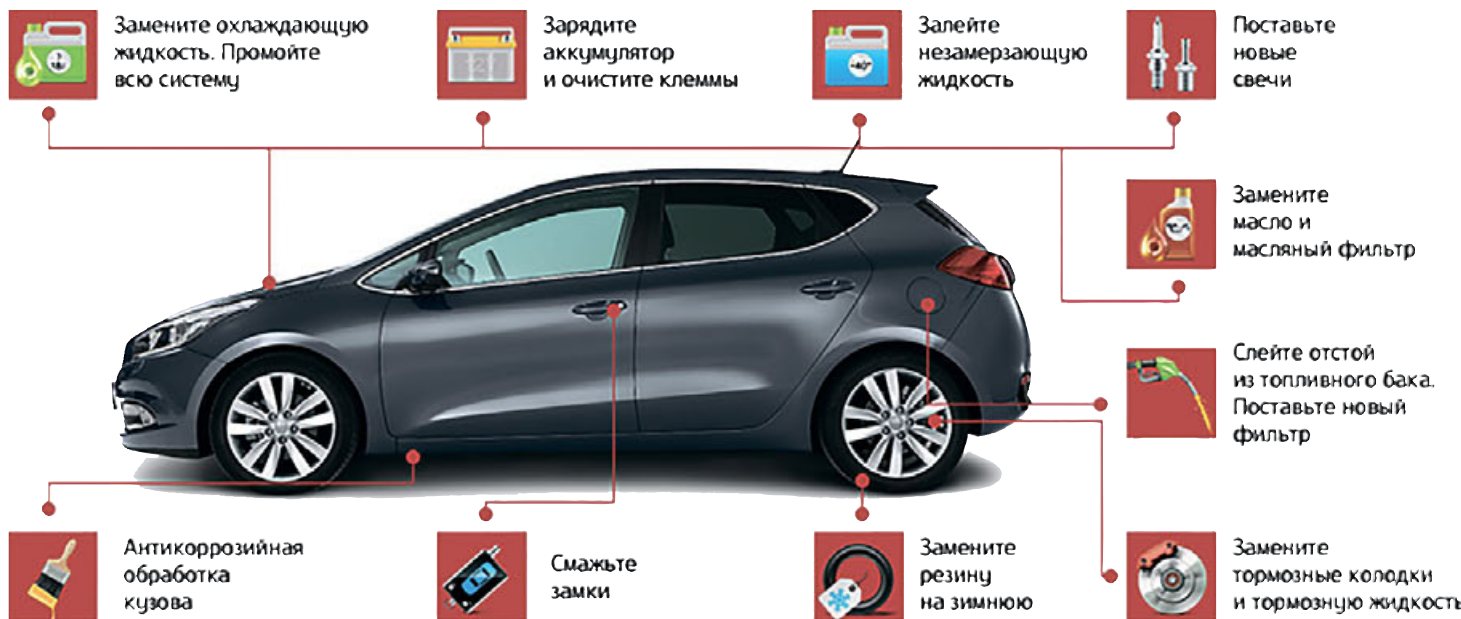
Рисунок из сети интернет