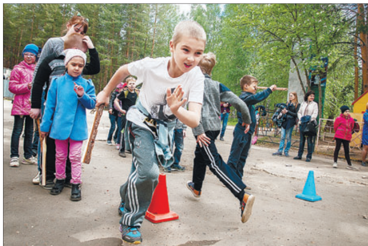
В минувшую субботу, 4 июня, здесь провели спортивный семейный праздник «Сказочное лето».

В прошлом номере в материале «Ухта готовится к празднованию 95-летнего юбилея Коми» допущена неточность. В празднике «Хоровод дружбы» (20 августа) ожидается участие артистов, в том числе из Венгрии, а не из Бельгии, как сказано в статье. Приносим свои извинения.