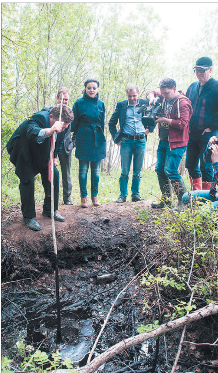
Нефтяной гейзер на реке Чуть.

Внутренняя компания журналистов и защитников природы 2 июня собралась у здания городской администрации Ухты, чтобы вместе с официальными лицами отправиться на объекты НШУ «Яреганефть». Цель поездки — на месте посмотреть, какие работы были проведены по устранению последствий загрязнения окружающей среды и рек нефтепродуктами, произошедшего весной этого года.